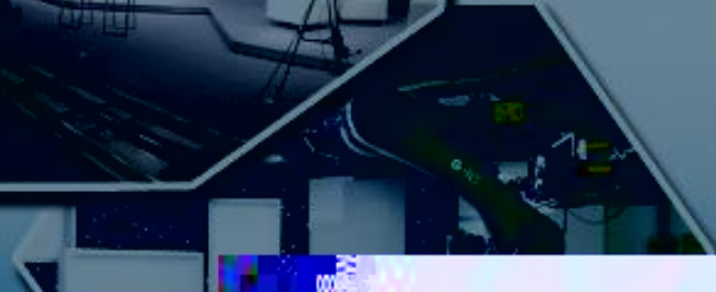
高速机器人摄像室